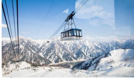
ขึ้นกระเช้าพาโนรามา