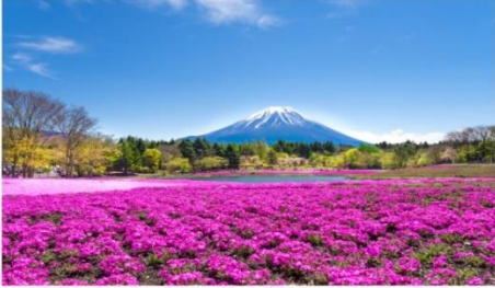
เทศกาลชิบะซากุระ