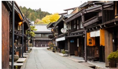
เมืองเก่าซันมาจิ