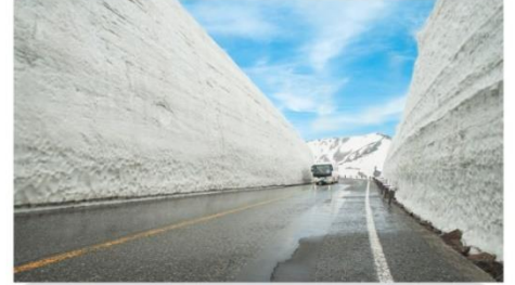
กำแพงหิมะ