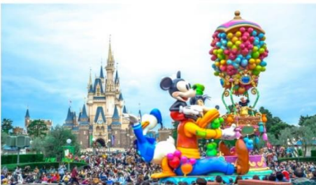
โตเกียวดิสนีย์