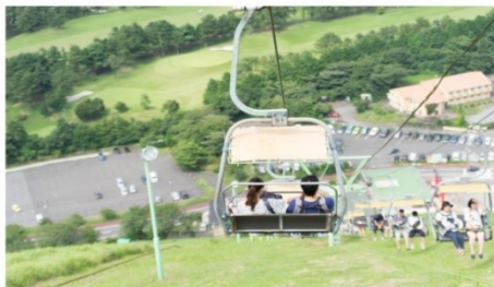
ขึ้นกระเช้าโอมูระ