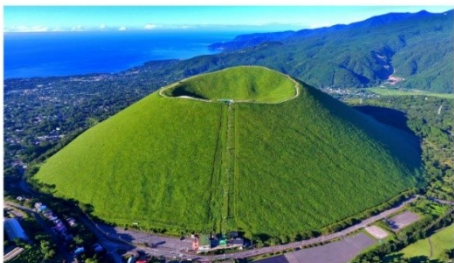
ภูเขาโอมูระ