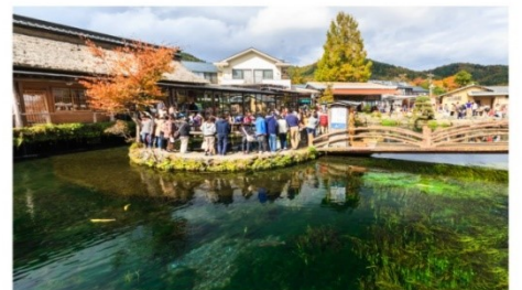
หมู่บ้านน้ำใสโอะชิโนะฮัทโก