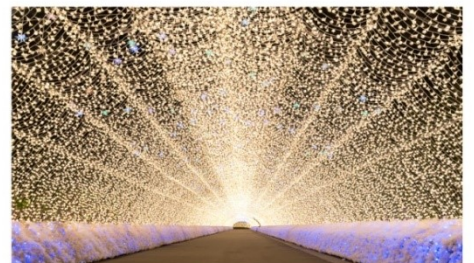
เทศกาลประดับไฟนาบาระโนะซาโตะ