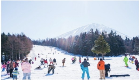
ลานสกีฟูจิเทน