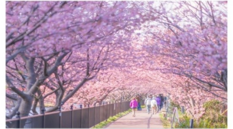
ซากุระคาวาสึ