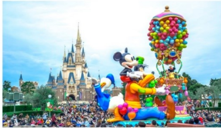
โตเกียวดิสนีย์แลนด์ (รวมตัว)