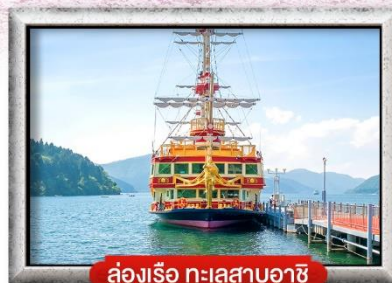
ล่องเรือ ทะเลสาบอาชิ