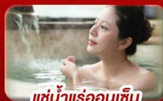
แช่น้ำแร่ร้อนเซ็น