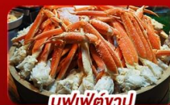
บุฟเฟ่ต์งาปู