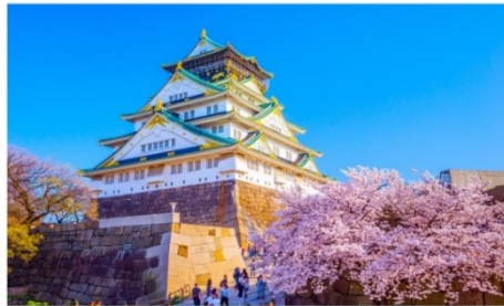
เจ้าชมปราสาทโอซาก้า