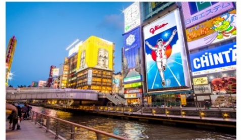
ชินโซบาชิจิโดทงโบริ