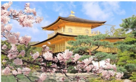
วัดคินคะคุจิ