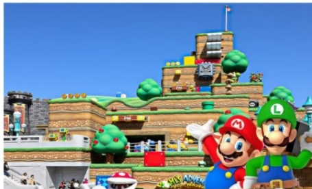
ยูนิเวอร์ซัลสตูดิโอส์