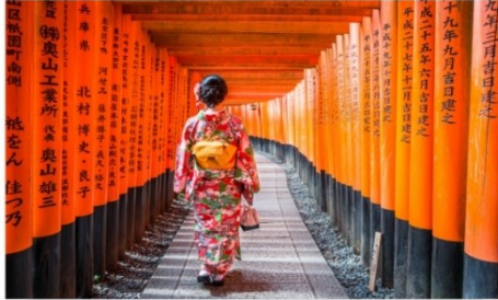
ศาลเจ้าฟูชิมิอินาริ