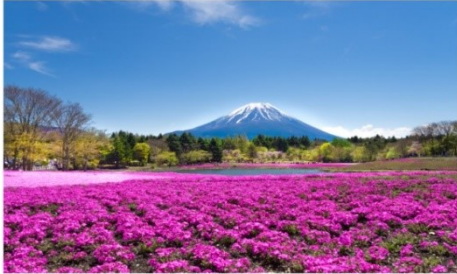
เทศกาลชิบะซากุระ