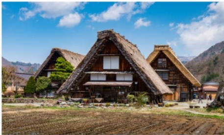
หมู่บ้านมรดกโลกชิราคาวาโกะ