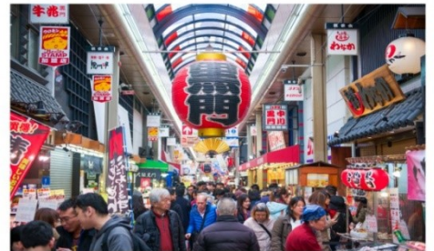
ตลาดคุโรเมง