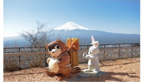
พื้นที่เช่าคางิ