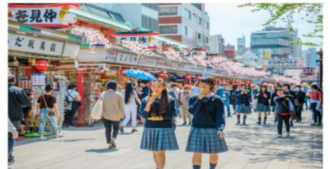
ถนนนาทิมิเสะ