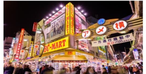
ตลาดอะเมโยโกะ