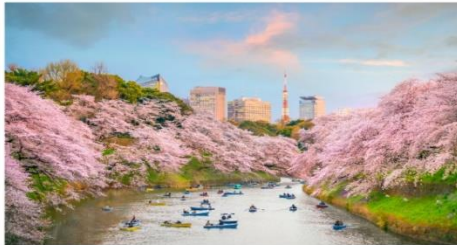
สวนอุเอโนะ