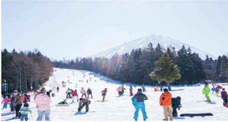
ลานสกีฟูจิเทน