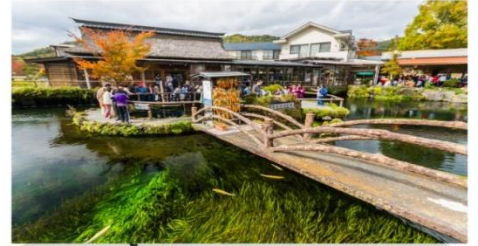
หมู่บ้านน้ำใส