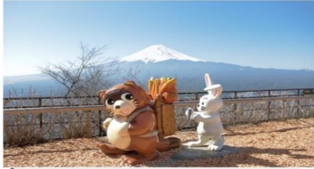
ขัณฑ์ระเซาคาจิ