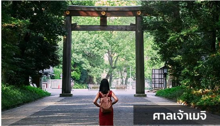
ศาลเจ้าเมจิ