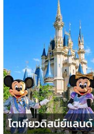
โตเกียวดิสนีย์แลนด์