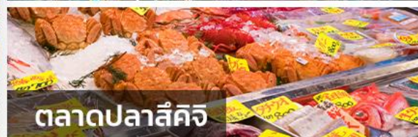
ตลาดปลาชิชิ

เช้า ๑๐ บริการอาหารเช้า ณ ห้องอาหารของโรงแรม