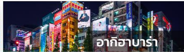
อากิฮาบาระ