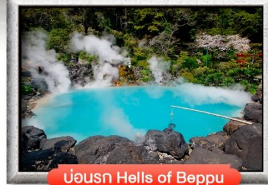
บ่อน้ำ Hells of Beppu