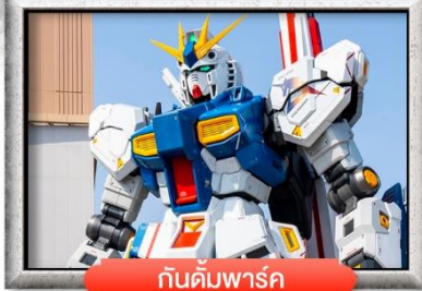
กันดั้มพาร์ค