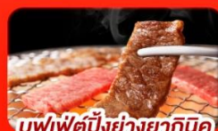
บุฟเฟ่ต์ย่างยากินิคุ