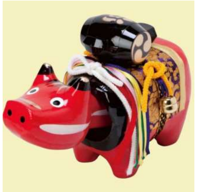
อาคะเบะโกะ สัญลักษณ์เมืองไอส์ึ