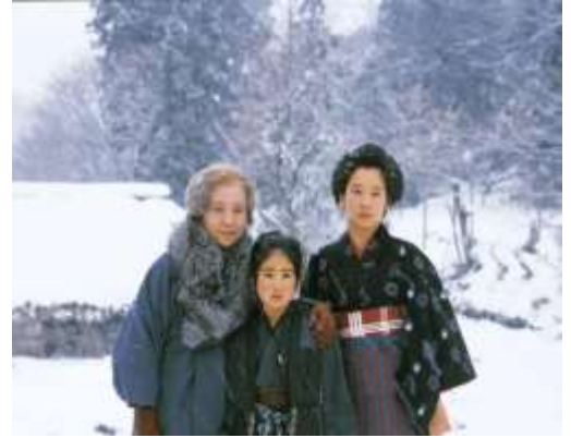
ซีรีส์ “สงครามชีวิตโอชิน (Oshin)”