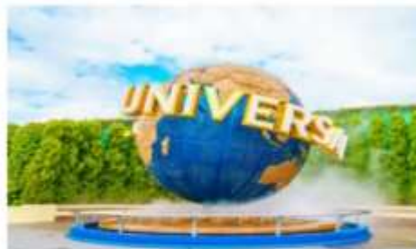
ยูนิเวอร์ซัล สตูดิโอส์