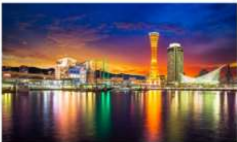
โทเนฮาร์เบอร์แลนด์