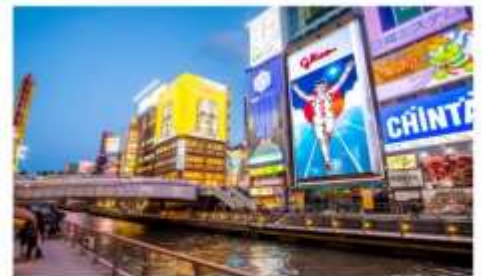
โดทงโมริ