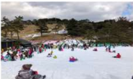
ลานสกีร็อคโค สโนว์พาร์ค