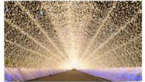
เทศกาลประดับไฟนาบะโนะซาโตะ