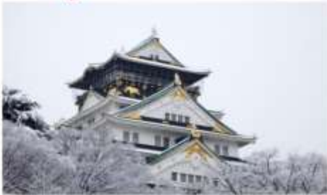
เข้าชมปราสาทโอซาก้า