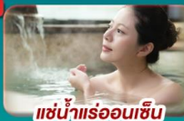
แช่น้ำแร่ออนเซ็น