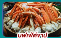
บุฟเฟ่ต์วาปู