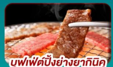
บุฟเฟ่ต์บิงย่างยากินคุ