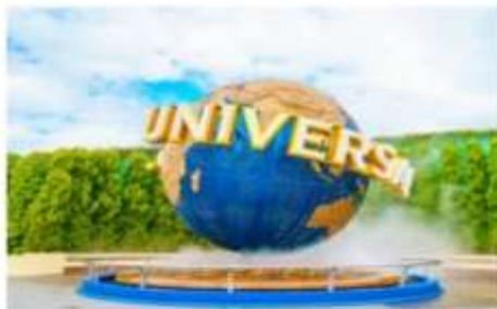
ยูนิเวอร์ซัล สตูดิโอส์