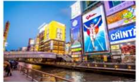
ย่านโดทงโบริ