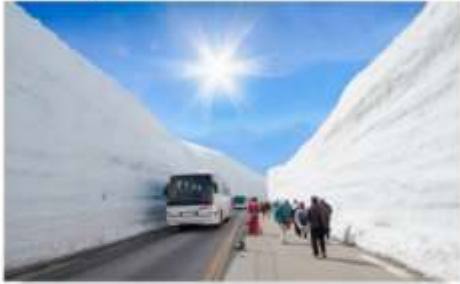
เจแปนแอลป์