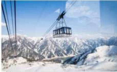
ขึ้นกระเช้าสู่เทือกเขาทาเทยามา