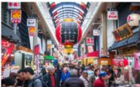
ตลาดคุโรมง