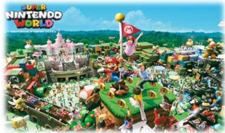
Super Nintendo World