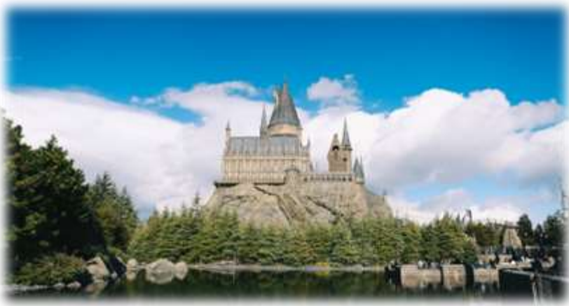
The Wizarding World Harry Potter