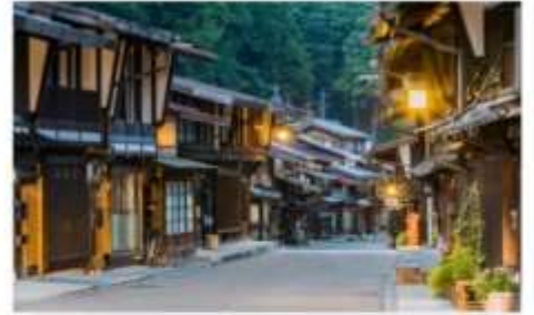
หมู่บ้านนารายณ์จุกุ