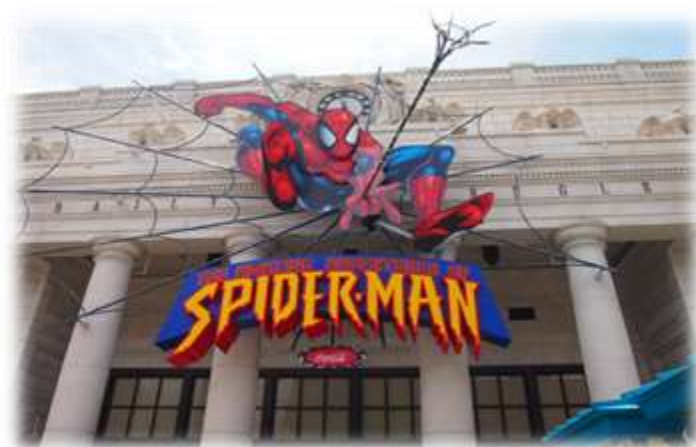
The Amazing Adventure of Spiderman