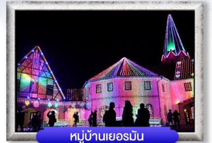
หมู่บ้านเยอรมัน

พิเศษ! บุฟเฟ่ต์ปิ้งย่างยากินิกุ, บุฟเฟ่ต์ซาปู