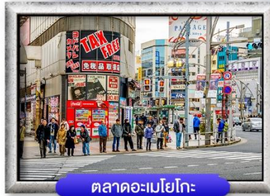
ตลาดอะเมโยโกะ