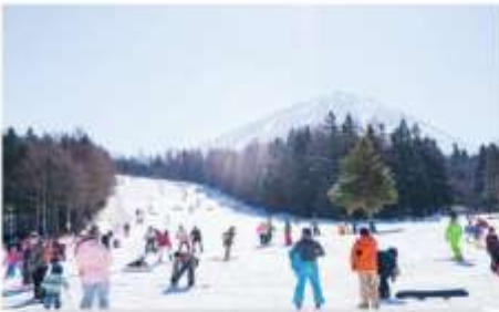
ลานสกีฟูจิเทน