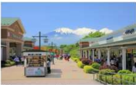
โทเทมบะเอาก์เล็ด