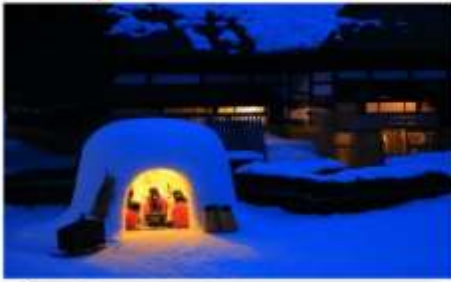
บ้านหิมะคามาคูระ