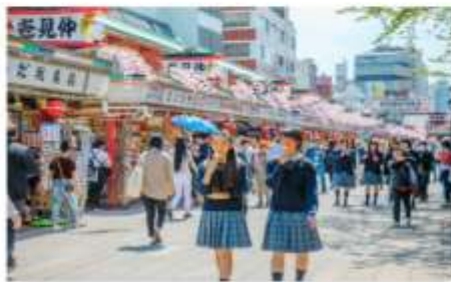
ถนนนากามิเสะ