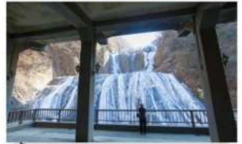
น้ำตกเยือกแข็งฟูคุโรตะ