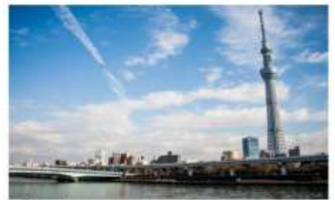
โตเกียวสกายทรี