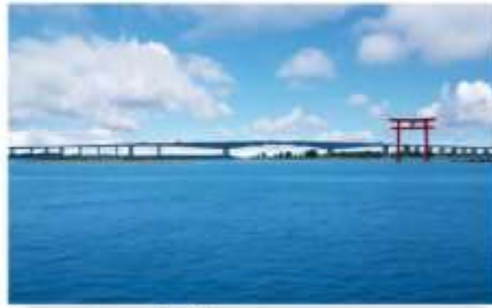
ทะเลสาบปลาไหลฮามานะ