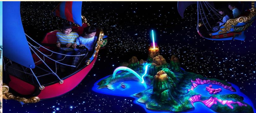
Peter Pan's Flight