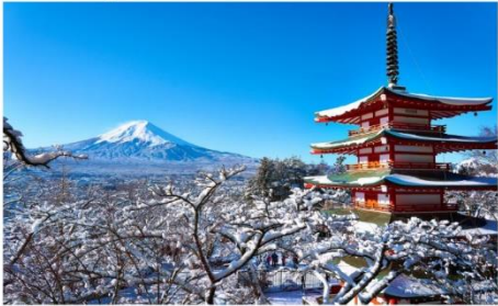
เจดีย์แดงซุเรโตะ