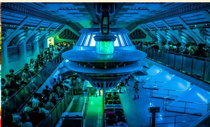
Star Tours: The Adventures Continue