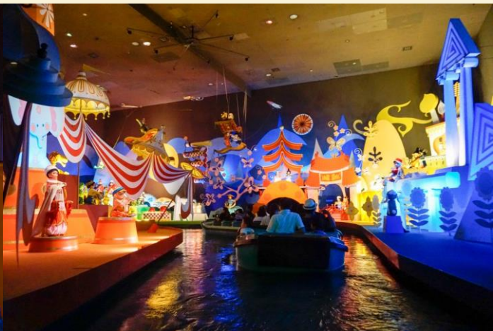
It's a small world