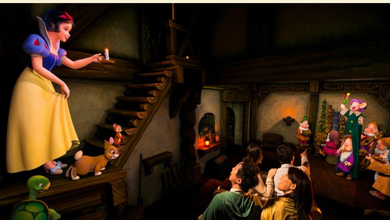
Snow White's Adventures