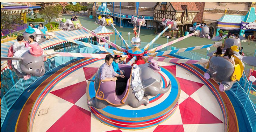
Dumbo The Flying Elephant