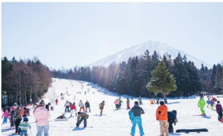
ลานสกีฟูจิเทน