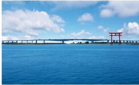
ทะเลสาบปลาไหลฮามานะ