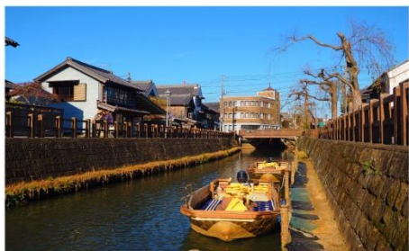
ลิตเต็ลโอโตะซาวาระ