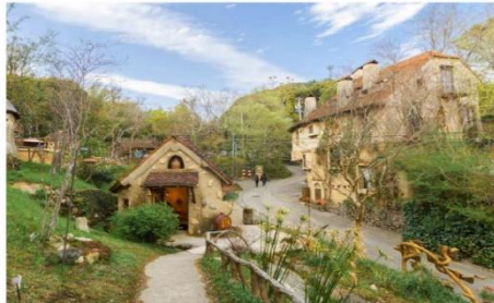
หมู่บ้านเทพนิยายบุคุโมริ