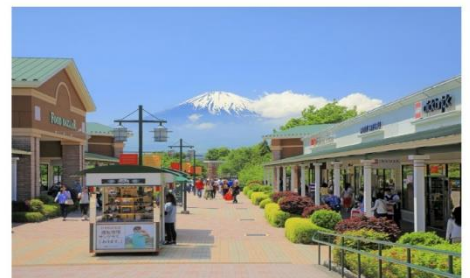
โกเทมบะเอาก์เล็ต