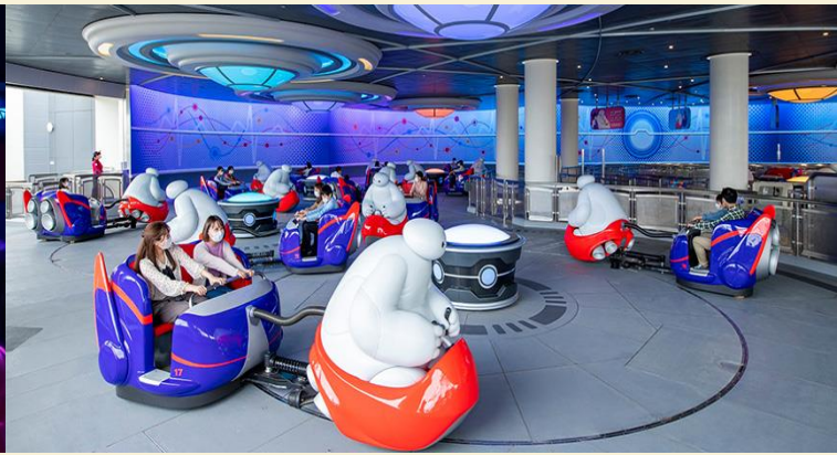
The Happy Ride with Baymax