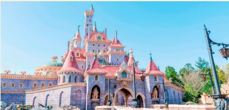
Enchanted Tale of Beauty and the Beast