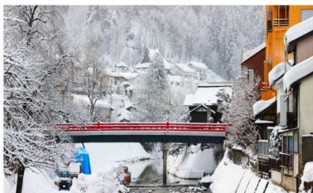
สะพานแดงนาคะบาชิ