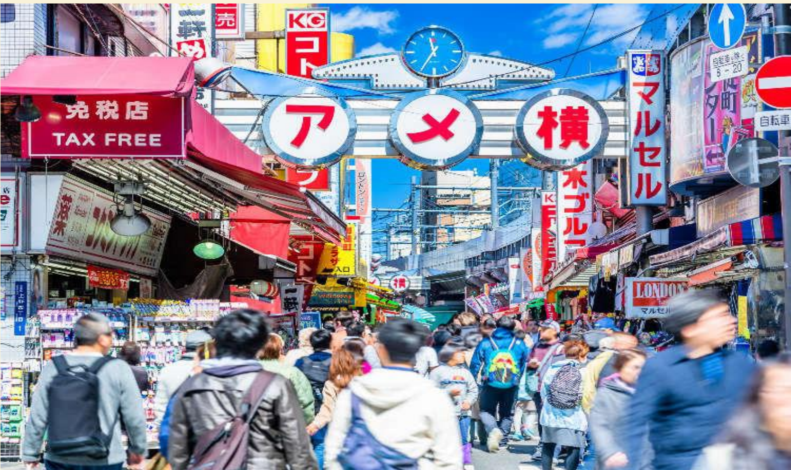
เดินทางสู่ ย่านอุเอโนะ นำท่านอิสระช้อปปิ้ง ตลาดอะเมะโยโกะ

โยฮาชิ เป็นสะพานเก่าซึ่งจะมีน้ำไหลออกมาจากสะพานทั้งสองด้านคล้ายน้ำตก ตรงนี้เป็นจุดแวะถ่ายรูปที่สวยงามจุดหนึ่งเลย เป็นเหมือนแลนด์มาร์คของชาวาระที่เดียว