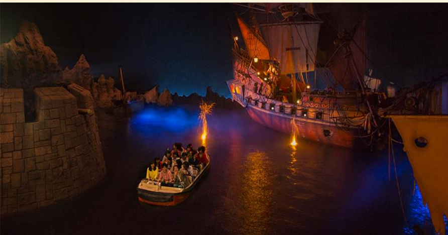
Pirates of the Caribbean