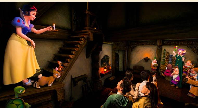
Snow White's Adventures