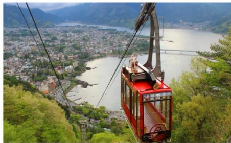
กระเช้าคาจิคาจิ