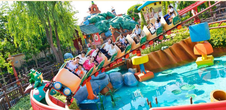
Gadget's Go Coaster