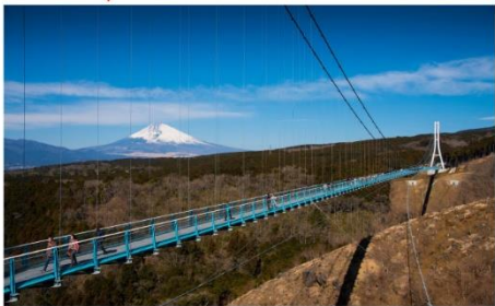
มิซึมะสกายวอล์ค