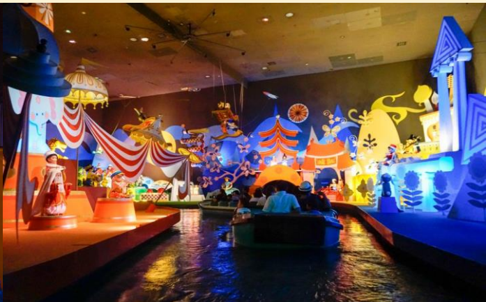
It's a small world