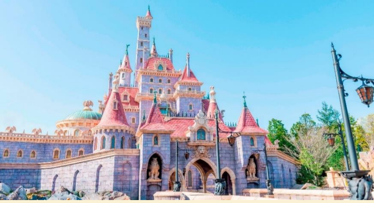
Enchanted Tale of Beauty and the Beast