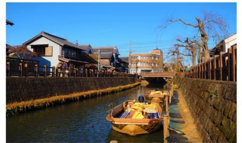
ลิตเติ้ลเอโดะซาวาระ