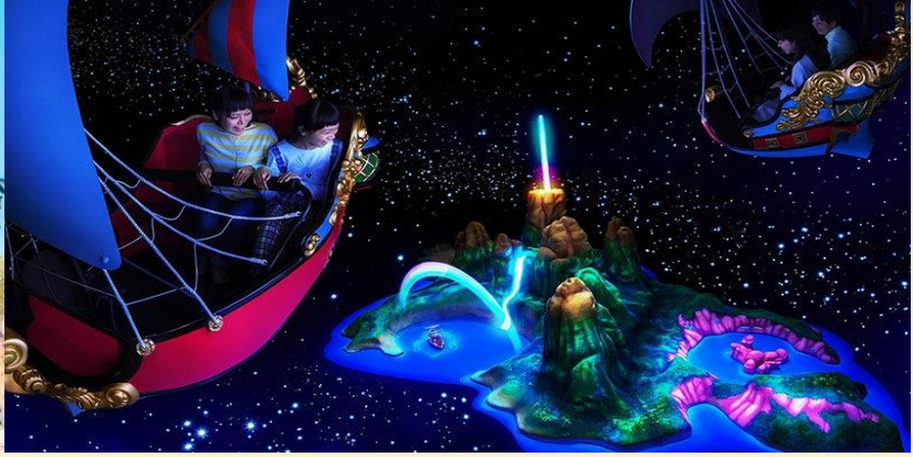
Peter Pan's Flight