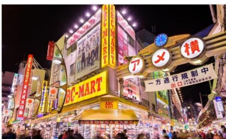
ตลาดอะเมะโยโกะ