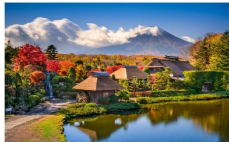
หมู่บ้านน้ำใสโอชิโนะซึกิ