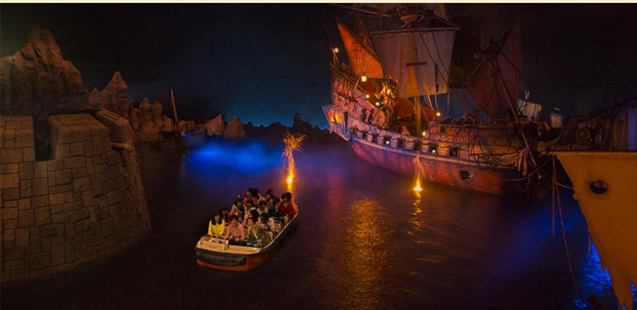
Pirates of the Caribbean

โตเกียวดิสนีย์แลนด์ เชิญท่านพบกับความอลังการซึ่งเต็มไปด้วยเสน่ห์แห่งตำนานและจินตนาการของการผจญภัย ใช้ทุนในการก่อสร้าง 600ล้านเยน โดยการมทะเล ท่านจะได้พบสัมผัสกับเครื่องเล่นในหลายรูปแบบ เช่น