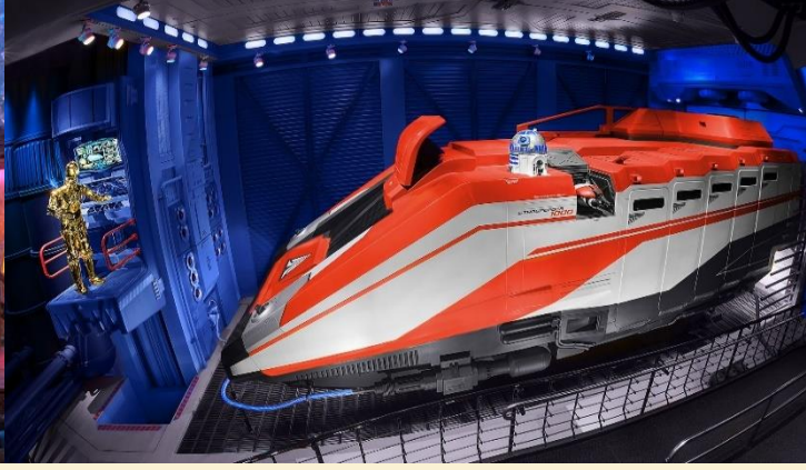
Star Tours: The Adventures Continue