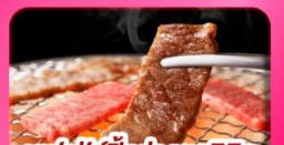
บุฟเฟ่ต์บิงย่างยากินุ