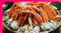
บุฟเฟ่ต์ซาปู