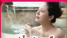
แช่น้ำแร่ร้อนเซ็น