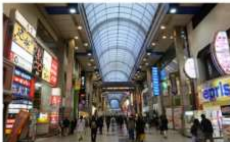
เซนได ถนนช้อปปิ้งอิชิบังโจ