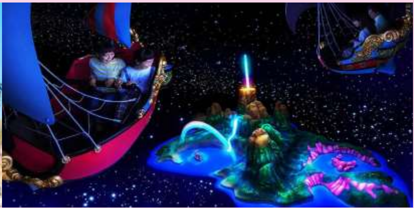
Peter Pan's Flight