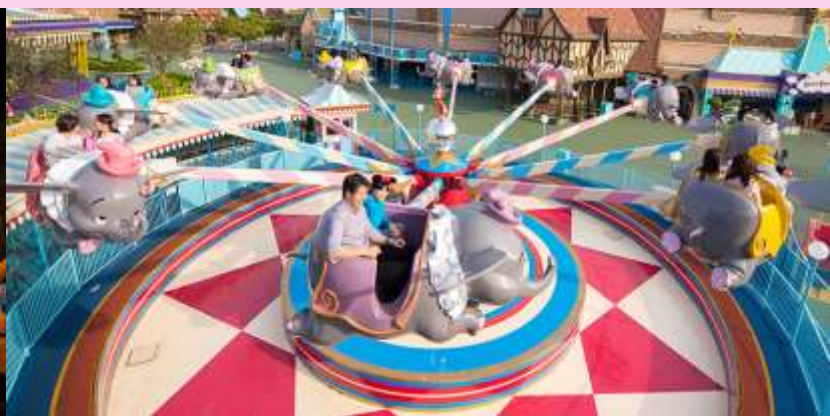
Dumbo The Flying Elephant