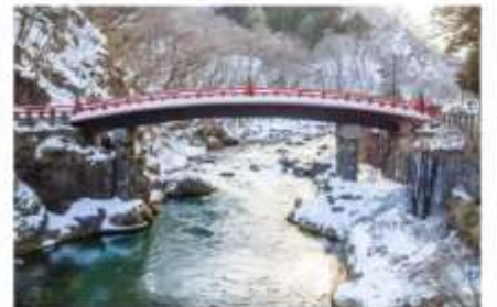
สะพานชินเคียว