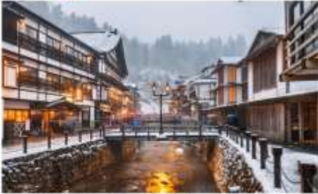
หมู่บ้านกินซังออนเซ็น