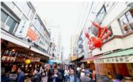
ตลาดปลาซึกิจิ