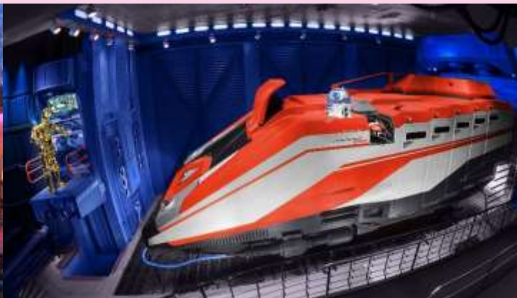
Star Tours: The Adventures Continue