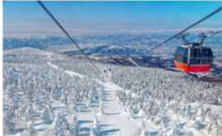
สโนว์มอนสเตอร์