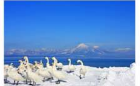
ทะเลสาบสวรรค์อินะวะซีโระ