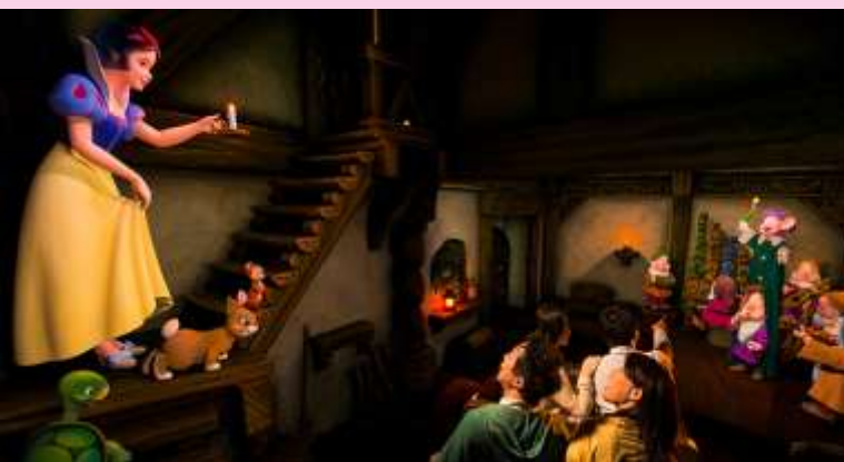
Snow White's Adventures