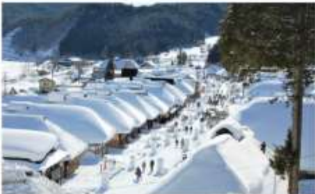
หมู่บ้านโอะอุจิคุ