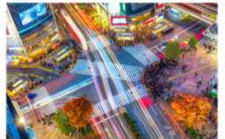
ย่านชิบูย่า