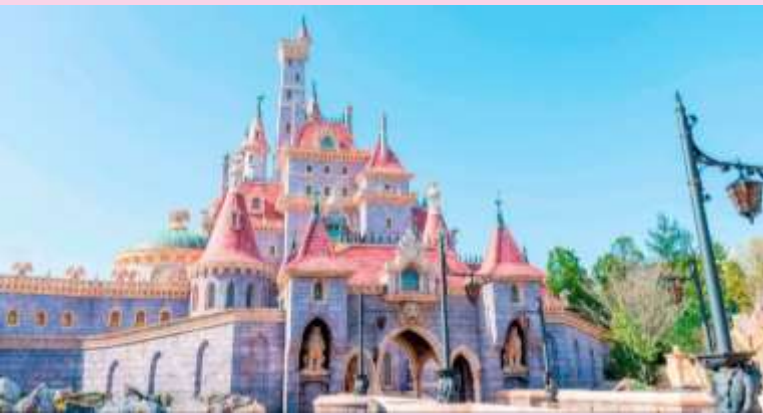
Enchanted Tale of Beauty and the Beast