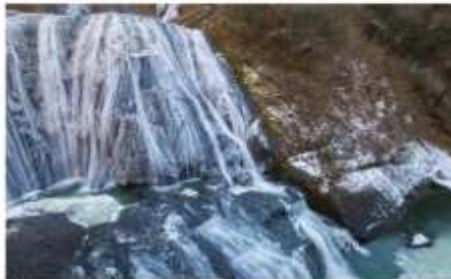
น้ำตกเยือกแข็งฟูคุโรตะ