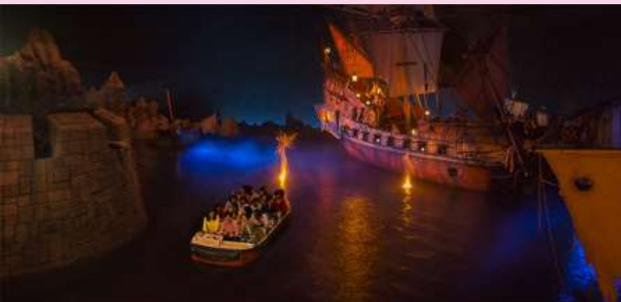
Pirates of the Caribbean

โตเกียวดิสนีย์แลนด์ เชิญท่านพบกับความอลังการซึ่งเต็มไปด้วยเสน่ห์แห่งตำนานและจินตนาการของการผจญภัย ใช้ทุนในการก่อสร้าง 600 ล้านเยน โดยการถมทะเล ท่านจะได้พบสัมผัสกับเครื่องเล่นในหลายรูปแบบ เช่น