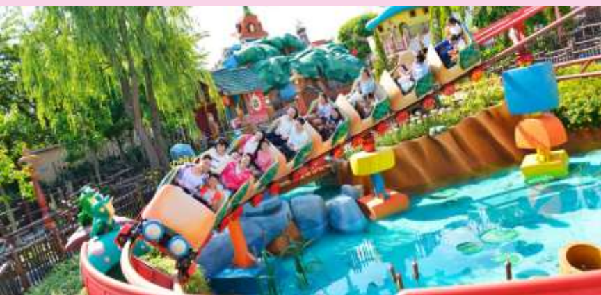
Gadget's Go Coaster