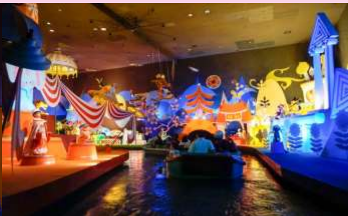
It's a small world