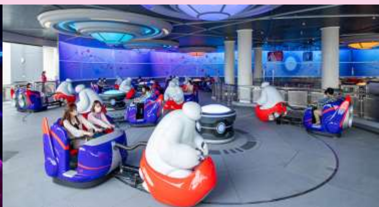
The Happy Ride with Baymax