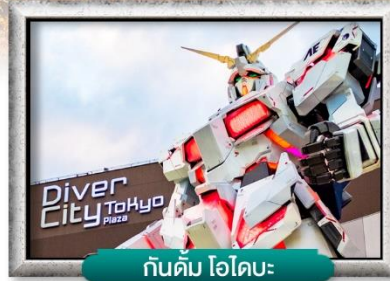
กันดั้ม ไอโดบะ

✍️ อีสรະท่องเที่ยวดำเนินการตามอัธยาศัยเต็มๆ 1 วัน