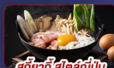
สุกียากี้ สไตลญี่ปุ่น