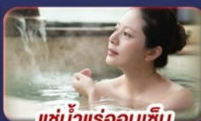
แช่น้ำแร่ออนเซ็น