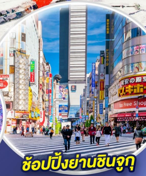
ช้อปปิ้งย่านชินจูกุ