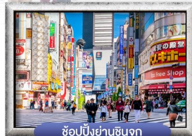
ช้อปปิ้งย่านชินจูกุ

พิเศษ! สุกียากี้ สไตลด์ญี่ปุ่น, บุฟเฟต์ปังย่างยากินิกุ