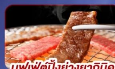
บุฟเฟ่ต์บิงย่างยากินิคู