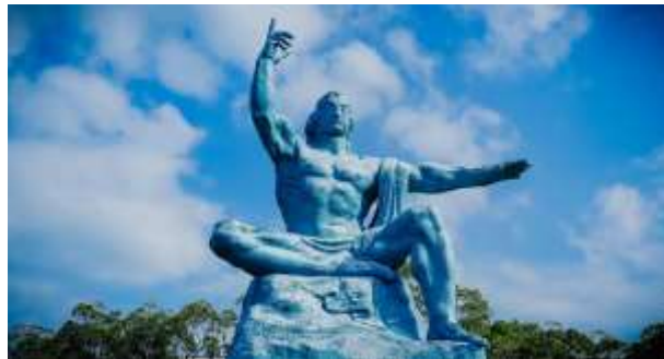
อุทยานรำลึกถึงเหยื่อระเบิดปรมาณู Peace Park

08.00 น. เรือจอดที่ท่าเรือ นางาซากิ ท่านสามารถเที่ยวเองอิสระไปเที่ยวสถานที่สำคัญต่างๆเดิมทีหรือซื้อทัวร์เสริมบนฝั่งกับทางเรือล่วงหน้าจะมีเจ้าหน้าที่แจ้งสถานที่นัดพบและเวลาเรือ หากท่านเที่ยวเองอิสระ กรุณากลับขึ้นเรือก่อนเรือออกอย่างน้อย 1-2 ชั่วโมง