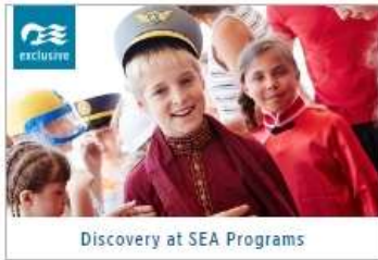
Discovery at SEA Programs

On every Princess ship, you'll find so many ways to play, day or night. Explore The Shops of Princess, celebrate cultures at our Festivals of the World or learn a new talent — our onboard activities will keep you engaged every moment of your cruise vacation. 1