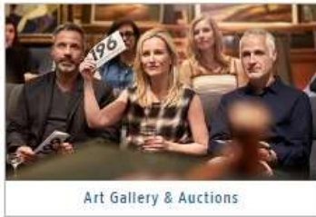
Art Gallery & Auctions