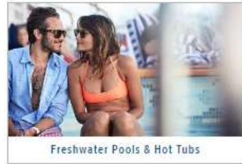
Freshwater Pools & Hot Tubs