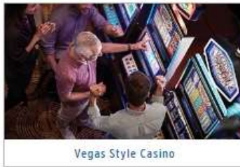
Vegas Style Casino