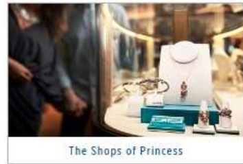
The Shops of Princess