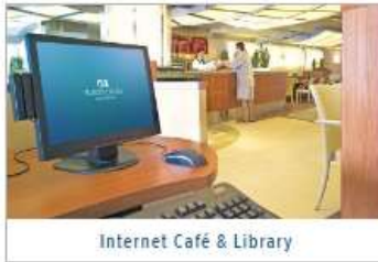
Internet Café & Library