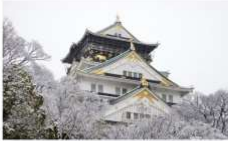
ปราสาทโอซาก้า(รวมตั๋วเข้าชม)