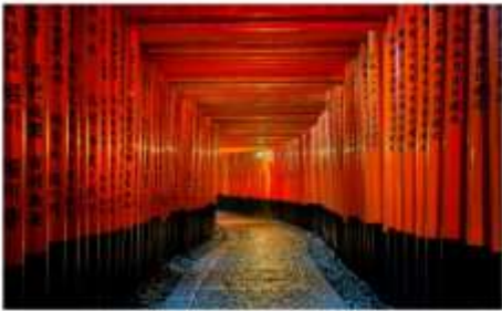
ศาลเทพเจ้าจิ้งจอกอินาริ