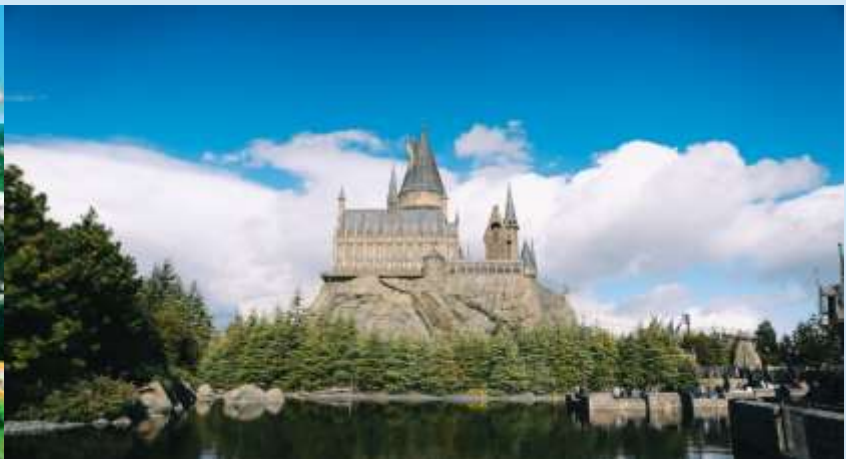
The Wizarding World Harry Potter