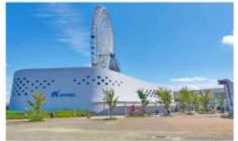
ฮอปบิงลาลาพอร์ต เอ็กซ์โปซิตี