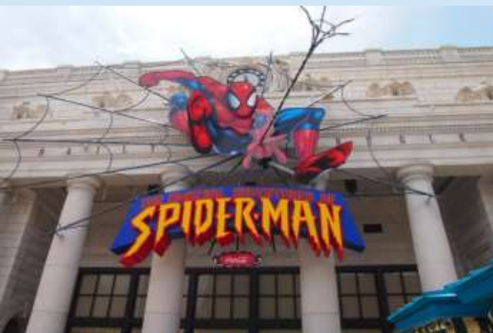
The Amazing Adventure of Spiderman