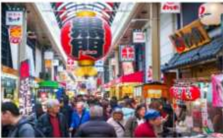
ตลาดคุโรมง