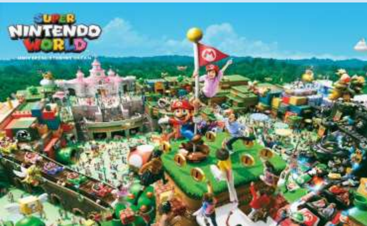
Super Nintendo World