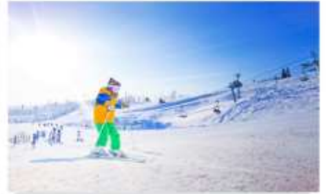
กิจกรรมลานหิมะ