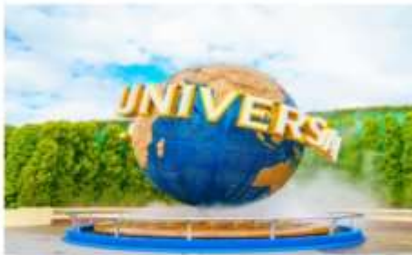
ยูนิเวอร์ซัลสตูดิโอ