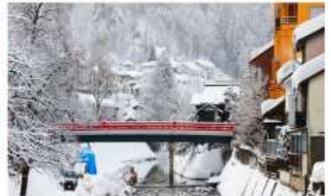
ถ่ายรูปคู่สะพานแดงนาคะบาชิ