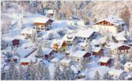
หมู่บ้านชิราคาวาโกะ(ขึ้นจุดชมวิว)