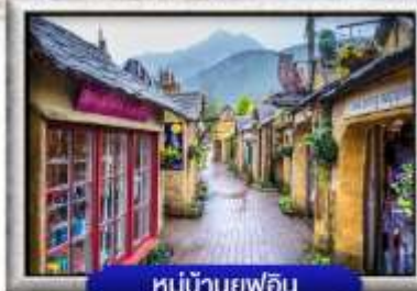
หมู่บ้านยูฟูอิน