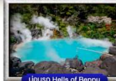
บ่อน้ำ Hells of Beppu

พิเศษ! บุฟเฟ่ต์ยาทินิกุ, สุกียากิ สไตลญี่ปุ่น