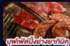
บุฟเฟ่ต์บึงย่างซากุระ