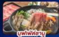
บุฟเฟ่ต์ซาบู