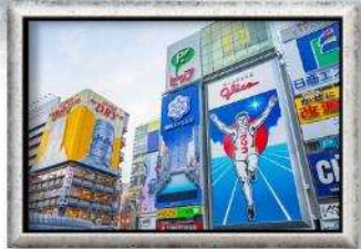
ชินโซมาชิ

บุฟเฟ่ต์บั้งย่างยากินิกุ , บุฟเฟ่ต์ซาบู 5 วัน 3 คืน เดินทาง ส.ค. 2565 อาหาร : 6 มื้อ