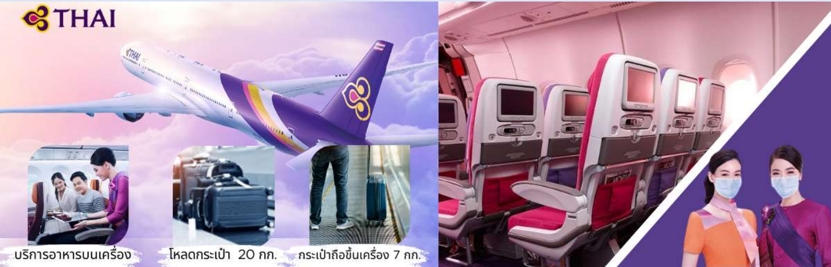
บริการอาหารบนเครื่อง

23.55 น. ออกเดินทางสู่ สนามบินซิดนีย์ (ฮอกไกโด) โดยการบินไทย เที่ยวบินที่ TG 670