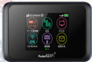
POCKET WIFI สำหรับนำไปใช้ที่ประเทศญี่ปุ่น