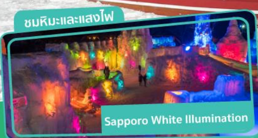
Sapporo White Illumination