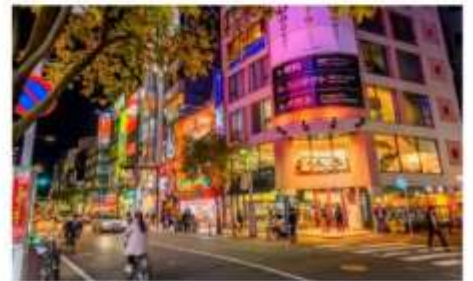
ช้อปปิ้งย่านเทนจิ