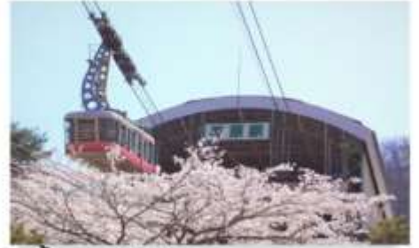
เซ็นกระเซาชมซากุระฤดูหนาว