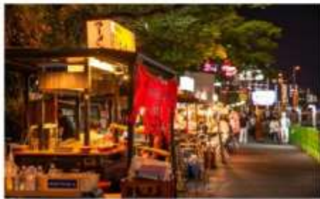
สตรีทฟู้ดฮากาตะ