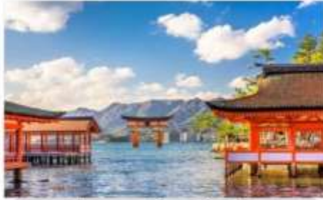
ศาลเจ้ามรดกโลกอิสึคุชิมะ