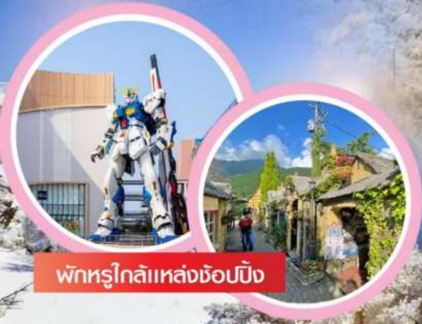
พักรูโกไลแหล่งช้อปปิ้ง