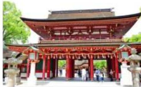
ศาลเจ้าดาไซฟู