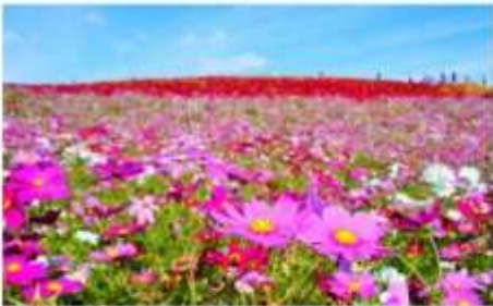
สวนโคโตะชิมะ