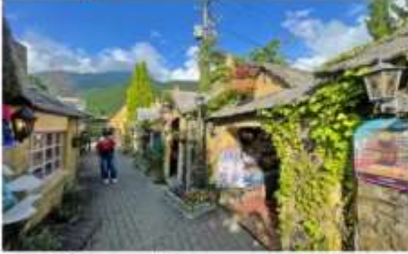
หมู่บ้านยูฟูจิน