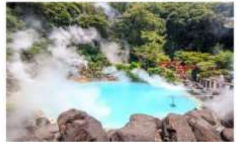
ยูมิ จิโกกุ (บ่อนรกทะเลเดือด)