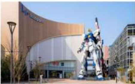
กันดั้มไฮโดมะ ห้างลาลาพอร์ต