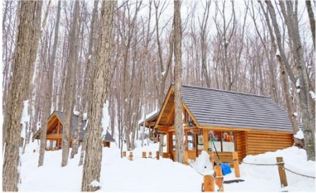
หมู่บ้านนิงเกิลเทอเรส