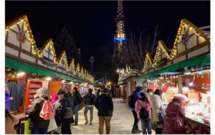
ตลาดคริสต์มาส