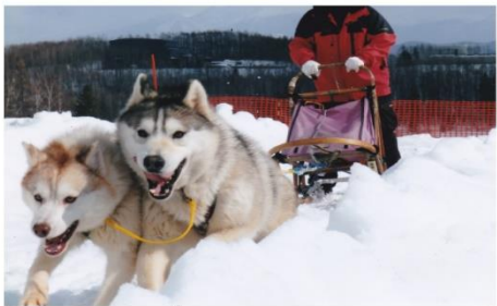
สุนัขลากเลื่อน