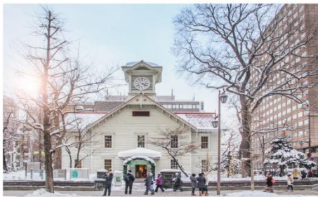
หอนาฬิกาซัปโปโร