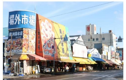
ตลาดปลาโนโงะ