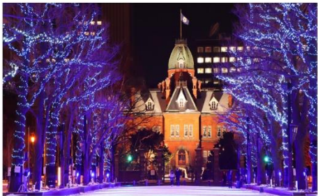
ชมงานประดับไฟฤดูหนาว