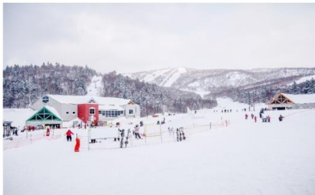
สกีรีสอร์ท คิโรโระ