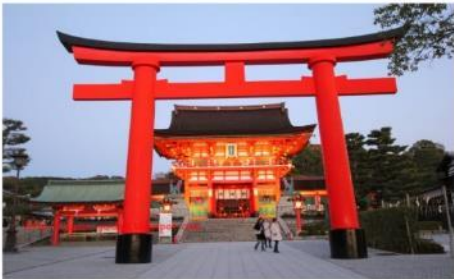
ศาลเทพเจ้าอินาริ