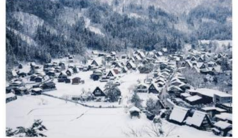
หมู่บ้านมรดกโลกชิราคาวาโกะ