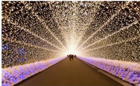
งานประดับไฟฤดูหนาว