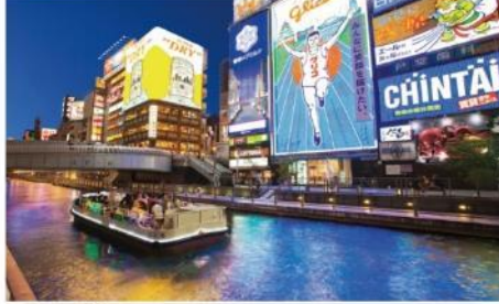
ช้อปปิ้งชินไซบาชิ โตเกียวโมริ