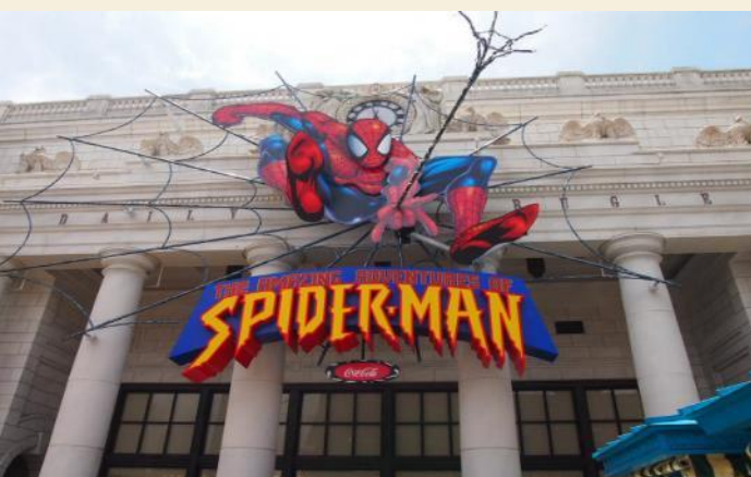
The Amazing Adventure of Spiderman