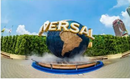
ยูนิเวอร์ซัลสตูดิโอส์ (รวมตัว)