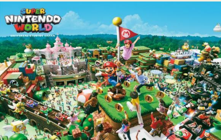
Super Nintendo World