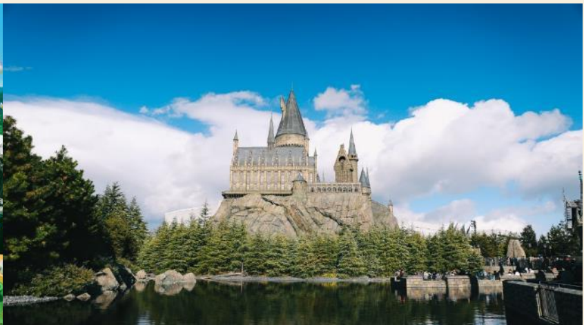
The Wizarding World Harry Potter