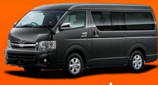
6-10 คน 25,000 THB / DAY