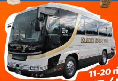
11-20 คน 28,000 THB / DAY