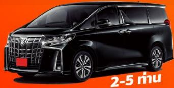
2-5 คน 18,000 THB / DAY