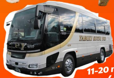
11-20 คัน 28,000 THB / DAY