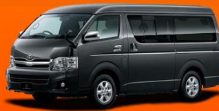
6-10 คัน 25,000 THB / DAY