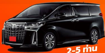
2-5 คัน 18,000 THB / DAY