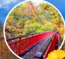
ชมใบไม้เปลี่ยนสี ที่สะพานฟูตามิ