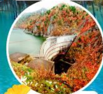
ชมใบไม้เปลี่ยนสี ริมเขื่อนโฮเฮเตียว