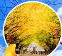
ชมต้นแปะก๊วยที่ Hokkaido University

เช็ครันครบ จบทุกที่ ใบไม้เปลี่ยนสีคึกคักบ่อน้ำสีฟ้า สวนสัตว์อาซาฮิยาม่า ชมใบไม้เปลี่ยนสีที่โจซังเท คลองโอตารุ พิพิธภัณฑ์น้ำแข็ง Ice pavillion ซ็อบบิงทานุกิโคจิ ศาลเจ้าฮอกไกโด พิพิธภัณฑ์เบียร์ชิบโปโร พิพิธภัณฑ์สาเก