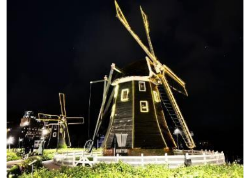
👉 พักค้างคืน ณ โรงแรม