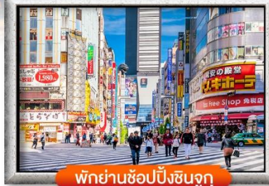
พิกย่านช้อปปิ้งชินจูกุ