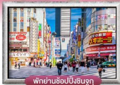
พิกย่านช้อปปิ้งชินจูกุ