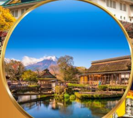
หมู่บ้านโอชิโนะฮะคิโค