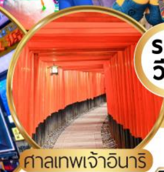
ศาลเทพเจ้าอันาริ