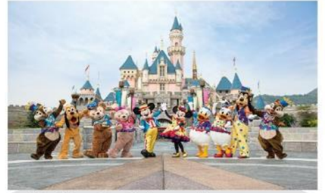
โตเกียวดิสนีย์แลนด์