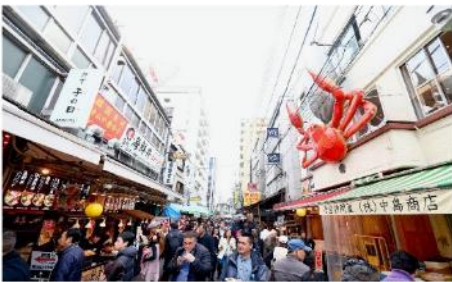
ตลาดปลาสึกิจิ