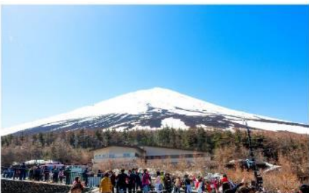
ภูเขาไฟฟูจิชั้นที่ 5