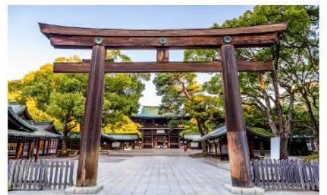
ศาลเจ้าเมจิ