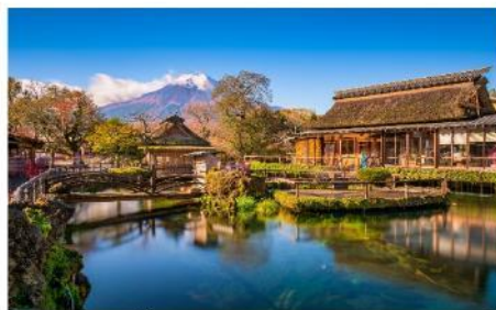
หมู่บ้านน้ำใส โอชิโนะ ฮกไก