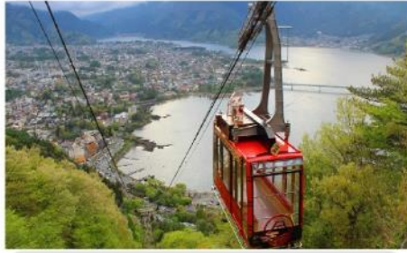
กระเช้าคาจิคาจิ