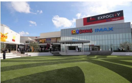
เอ็กซ์โปซิตี