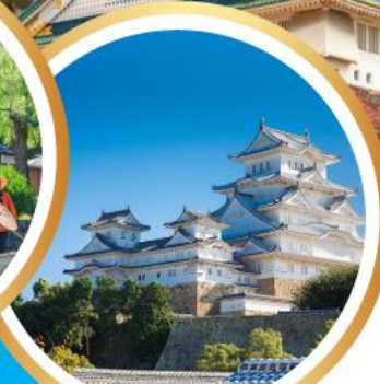
ปราสาทฮิเมจิ