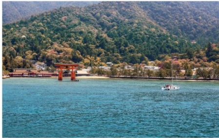
ศาลเจ้ามรดกโลก อีสึคุชิมะ