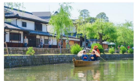
เขตอนุรักษ์คุราชิกิบิคัง