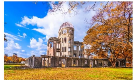
โดมปรมาณู