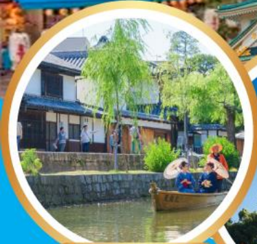
เขตอนุรักษ์คุราซึกิบิคัง