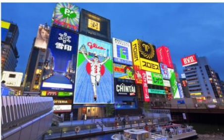
ย่านโดทงโบริ