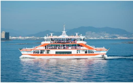
ล่องเรือสู่เกาะมียาจิมะ