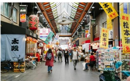
ตลาดคุโรมง