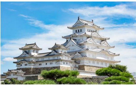
ปราสาทฮิเมจิ