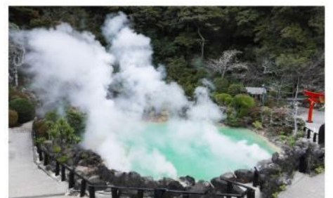
ออนเซ็นเบปปุ