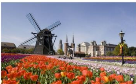
สวนสนุกเฮ้าส์เทนบอส