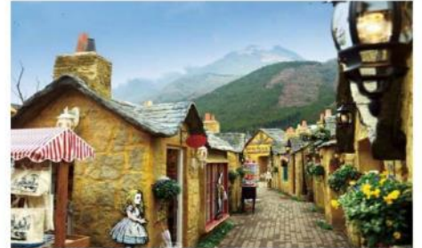
หมู่บ้านยูฟูอิน