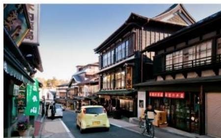
ถนนช้อปปิ้งโอโมเตะเซนโด