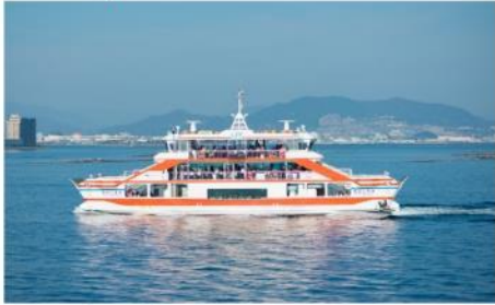
ล่องเรือสู่เกาะมียาจิมะ