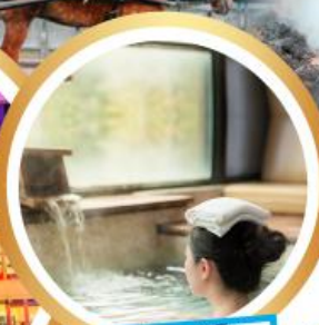
แช่ออนเซ็น