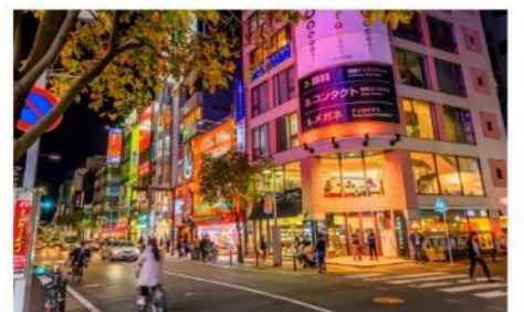
ช้อปปิ้งย่านเทนจิ