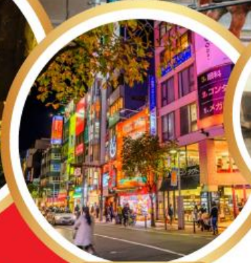
ช้อปปิ้งย่านเทนจิ