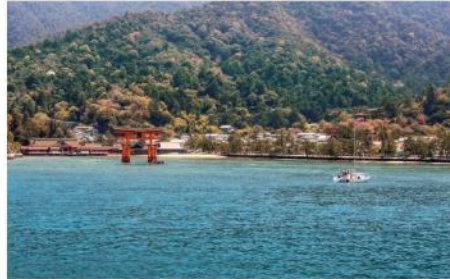
ศาลเจ้ามรดกโลก อีสึคุชิมะ