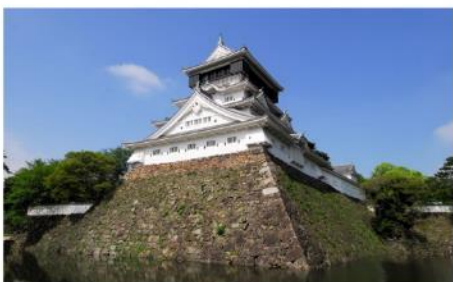
ปราสาทโคคุระ