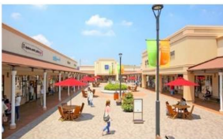
โทสุฟรีเมียมเอาก์เล็ท