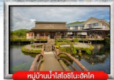
หมู่บ้านน้ำใสโอชิโนะฮักโค