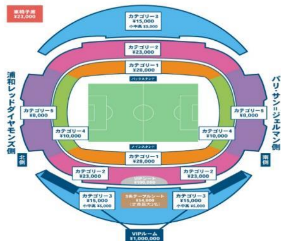
Saitama Stadium > Urawa Red Diamonds