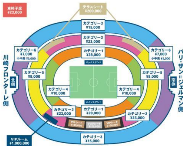
National Stadium > Kawasaki Frontale