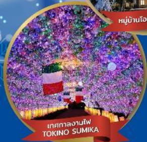
เทศกาลงานไฟ TOKINO SUMIKA