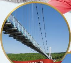
สะพานแขวน MISHIMA SKYWALK