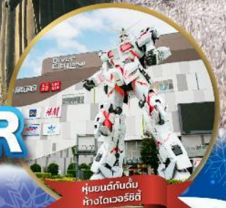
หุ่นยนต์กันดั้ม ทางโอเอชิ

พักออนเซ็น 1 คืน / โตเกียว 1 คืน / นาริตะ 1 คืน