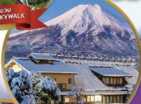
หมู่บ้านโอชิโนะวัคโก