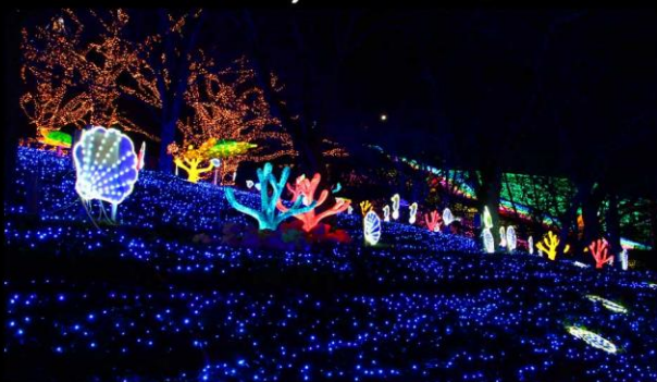
งานประดับไฟหาลกะมิกะ