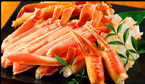
พิเศษ!บุฟเฟต์หาลปู