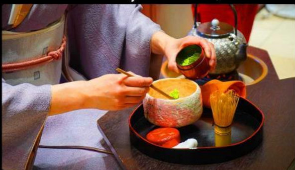
เรียนพิธีชงชา