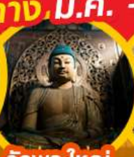
วัดพระใหญ่ โทโซจิ