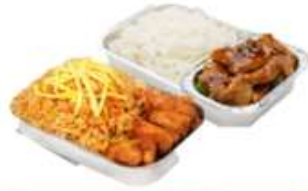
บริการอาหารร้อน ไป-กลับ บนเครื่อง

** เนื่องจากเป็นลัทธิ จึงไม่สามารถใส่ถุงพลาสติก **