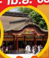
ศาลเจ้าดาไซฟุ