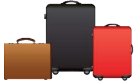
น้ำหนักกระเป๋า 20 กิโลกรัมต่อ

** เนื่องจากเป็นลัทธิ จึงไม่สามารถใส่ถุงพลาสติก **