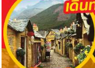
หมู่บ้านฮุฟูอิน