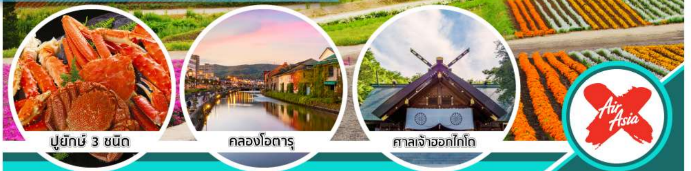
ปูยักษ์ 3 ชนิด