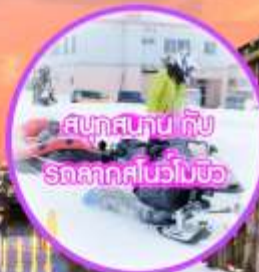
สนุกสนุกกับ รถลากส์โบว์โมจิ

ซีโทเซ่ - อะซาฮิกาวะ - หมู่บ้านราเมน สวนสัตว์อะซาฮิยามะ - ช้อปปิ้งถนนเฮวะ - อีออน มอลล์ - สนุกสนานหิมะลานสกีซึกิไซ (สระน้ำอะโออิเคะ) - โอดารุคลองโอดารุ - พิพิธภัณฑ์กล่องดนตรี - ซัปโปโร - อิสระตามอัธยาศัยตลอดทั้งวัน