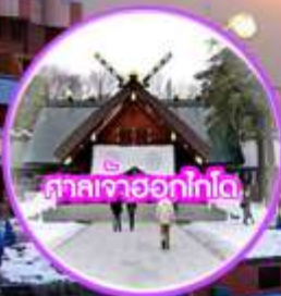
ศาลเจ้าออกไกโด

THAI | ราคาเริ่มต้น 33,900.- ธันวาคม - เมษายน 2563