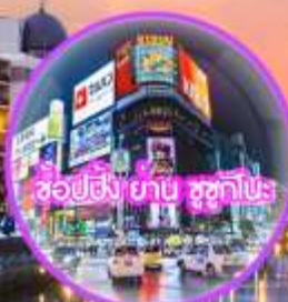
ช้อปปิ้ง ย่าน ซุกุบิระ