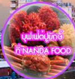
บุฟเฟ่ต์บุ๊ทซ์ ที่ NANDA FOOD