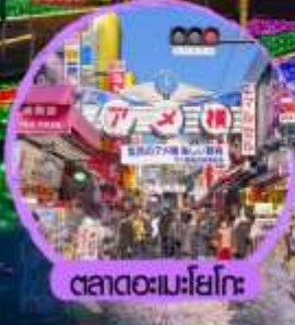
ตลาดอะเมะโยโกะ