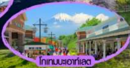
โกเทมมะฮากาเอะ