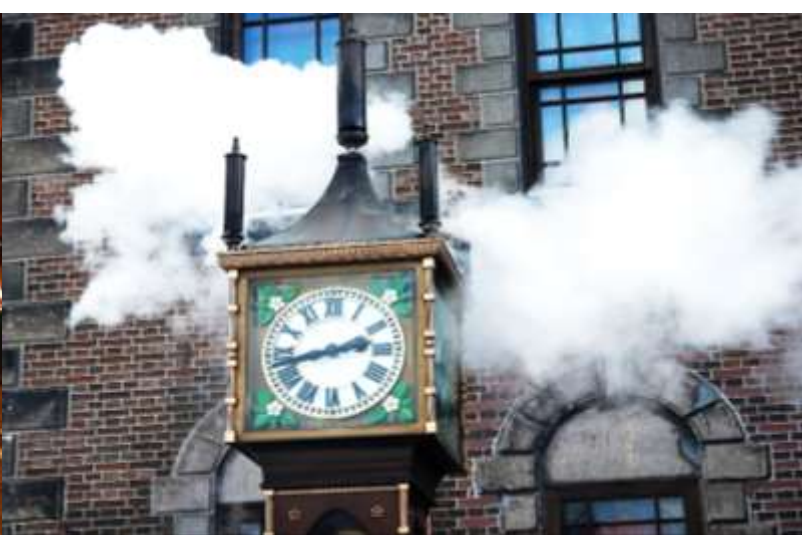
สิ่งที่สะดุดตาคือด้านหน้าพิพิธภัณฑ์ขั้วมี "นาฬิกาไอน้ำโบราณ (Stream Clock)" ที่ยังคงใช้งานได้มาจนถึงปัจจุบันและเหลือเพียง 2 เรือนในโลกเท่านั้น