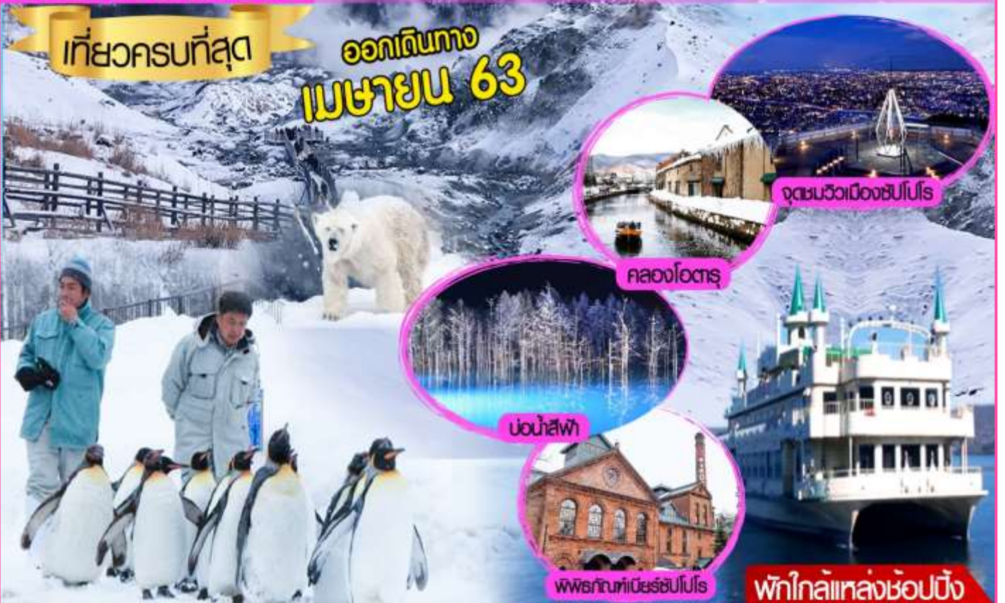
จุดชมวิวเมืองซัปโปโร