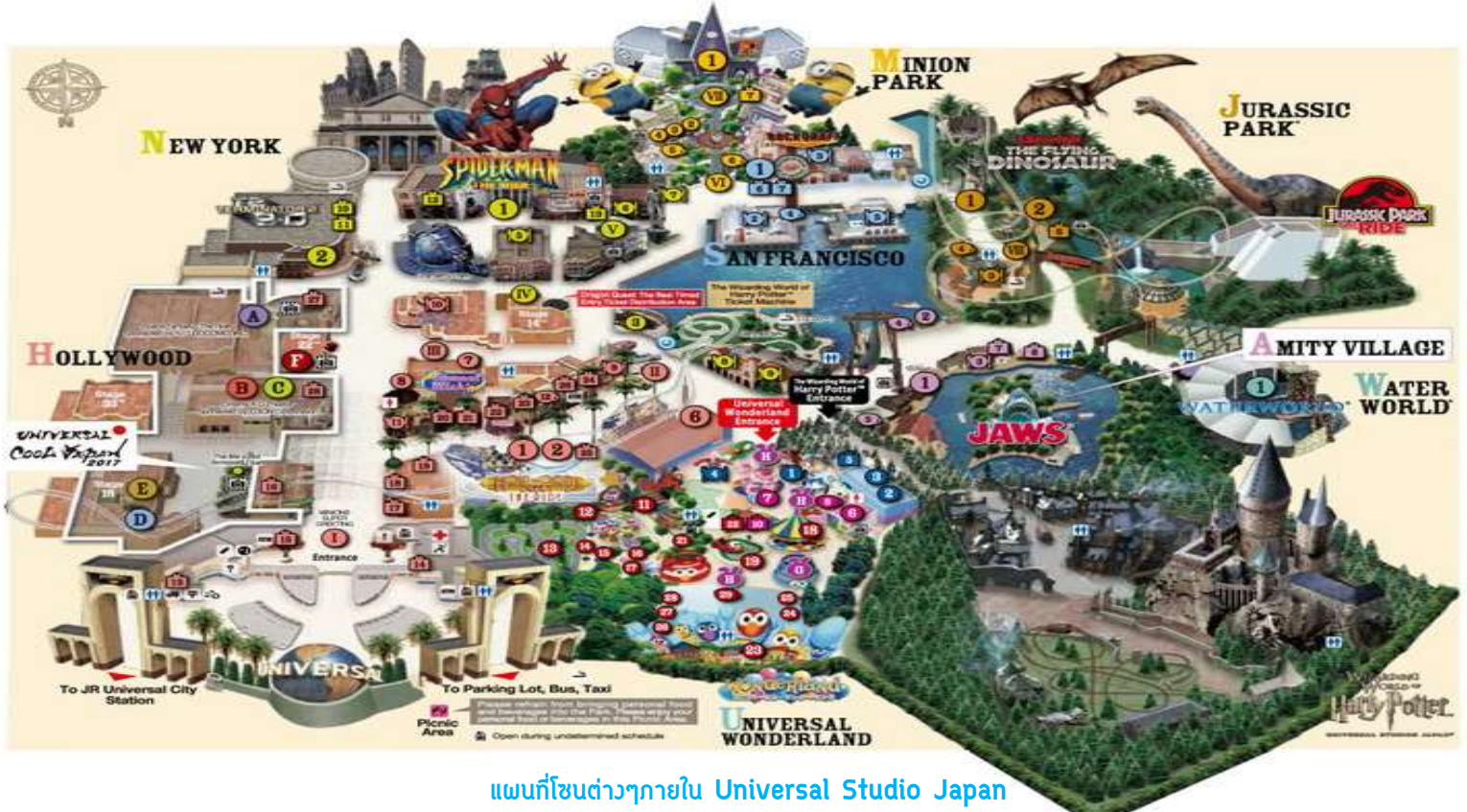
แผนที่โซนต่างๆภายใน Universal Studio Japan

เพื่อเป็นการไม่รบกวนเวลา 📍 อีสรະรับประทานอาหารกลางวันและอาหารค่ำตามอัธยาศัย